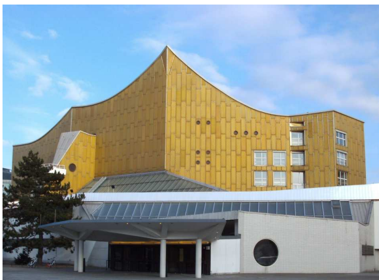
Philharmonie, © B. Klein 2018

Sicherlich ist die Berliner Philharmonie sein bekanntestes Werk in der Stadt. Aber schon vor 90 Jahren sind seine Entwürfe in der Stadt gebaut worden, seien es Einfamilienhäuser oder auch Siedlungen als Stadt in der Stadt.